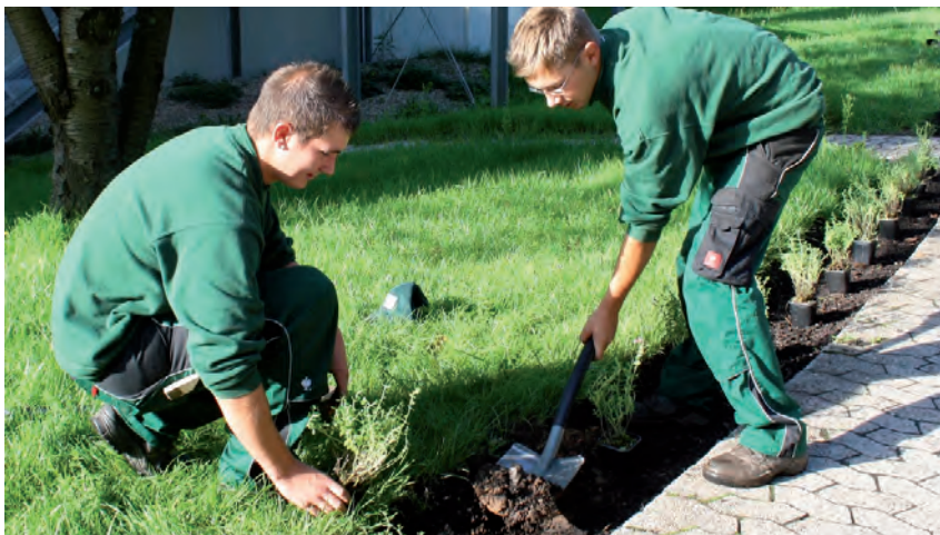
Garten- und Landschaftspflege

Ausbildung zum Dachdecker mit anschließender Berufserfahrung // Berufskolleg Hagen mit abgeschlossener Fachhochschulreife // Studium an der FH Gelsenkirchen Facility Management mit Abschluss als Diplom-Wirtschafts-Ingenieur // Praktikum bei der VOGT-GRUPPE mit anschließender Festbeschäftigung // Derzeit Projektleiter bei der VOGT GmbH in Heidelberg