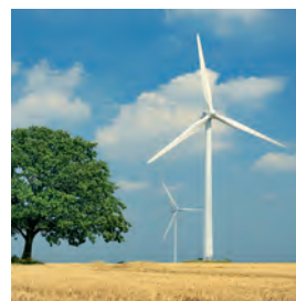
Technische Wartung von Windkraftanlagen

Mittlerweile war das Thema Facility Management geboren und ein komplexes Dienstleistungsangebot um die ganze Immobilie war gefor-