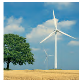
Technische Wartung von Windkraftanlagen

Mittlerweile war das Thema Facility Management geboren und ein komplexes Dienstleistungsangebot um die ganze Immobilie war gefor-