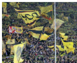
Südtribüne BVB 09