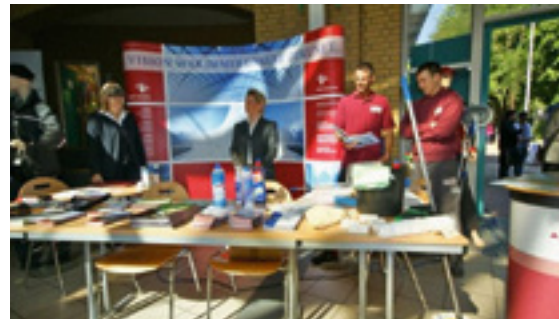
Berufsinformationstag in der Anne-Frank-Gesamtschule Dortmund

len, wie hier bei der Anne-Frank-Gesamtschule oder der Wilhelm-Busch-Realschule genauso wichtig wie der Berufsinformationstag in der Industrie- und Handelskammer oder auch bei Ausbildungsbörsen für Jugendliche mit Migrationshintergrund im Dietrich-Keuning-Haus in Dortmund. ▲