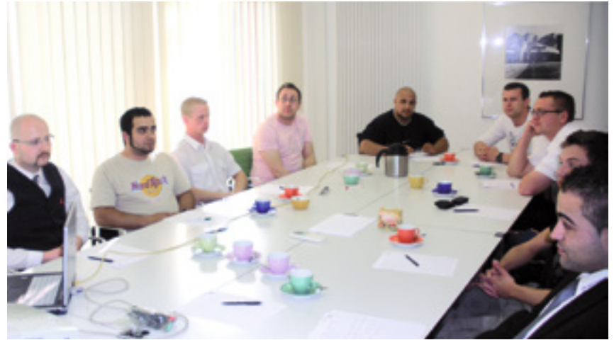
Abbildung oben: Die Auszubildenden beim Meeting